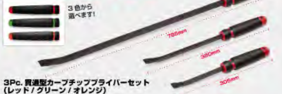
3Pc. 買選型カーブチッププライヤーセット (レッド/グリーン/オレンジ)