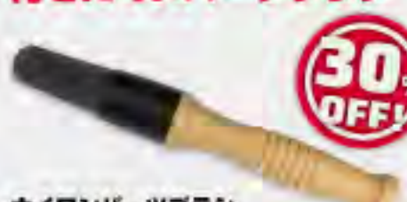
ナイロンパーツブラシ

PB1000 SPECIAL PRICE ..... ¥3,520 ¥2,500