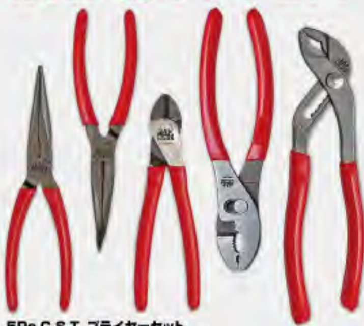
5Pc. C.S.T. プライヤーセット

●セット内容: ①ロングノーズプライヤー-カッター付 (全長 190mm, 最大開口幅 45mm, 刃先長 71mm), ②バントロングノーズプライヤー-カッター付 (全長 200mm, 最大開口幅 45mm, 刃先長 71mm), ③ダイアゴナルカutting プライヤー (全長 174mm, 最大開口幅 19mm, 刃先長 20mm), ④スリッジョイントプライヤー (全長 213mm, 最大開口幅 20mm, 刃先長 49mm), ⑤アジャスタブルジョイントプライヤー (全長 227mm, 最大開口幅 20mm, 刃先長 30mm)