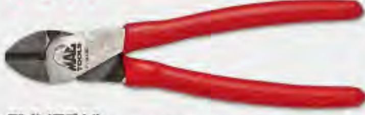
7" ダイアゴナルカutting C.S.T. プライヤー

●仕様: 全長 174mm, 刃先長 20mm, 材質 高炭素鋼 P7DCCST ..... ¥8,120