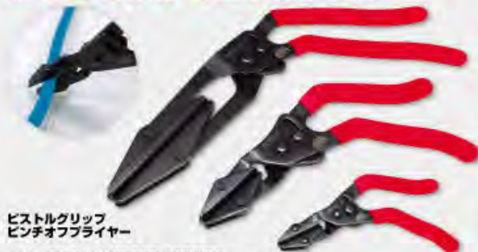
ピストルグリップ ピンチオフプライヤー