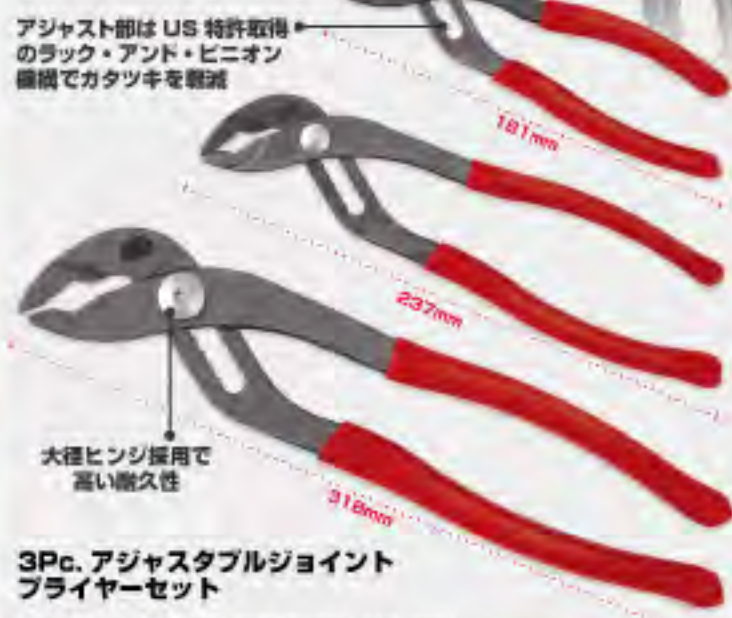
3Pc. アジャスタブルジョイントプライヤーセット

上アコと下アコの歯の向きが異なっている為、円形の物でもアコが滑るリスクを軽減。しっかり掴めます