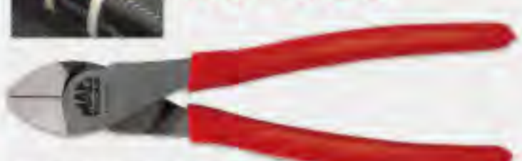
7" フラッシュカット C.S.T. プライヤー

●仕様: 全長 180mm, 刃先長 18mm, 材質 高炭素鋼 P7FCCST ..... ¥11,730