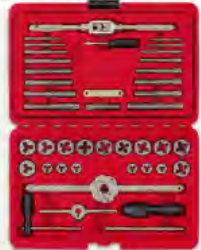
METRIC 41Pc. メトリック タップダイスセット