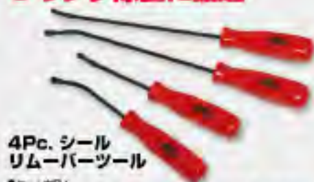
4Pc. シール リムーバーツール