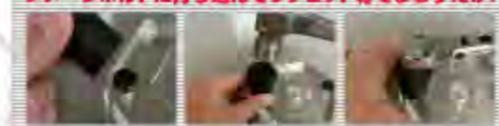
R.B.R.T. エクストラクターセット