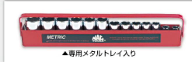
▲専用メタルトレイ入り

様々な作業を行うメカニックの 作業効率を考えた高さの インターミディエイトソケット