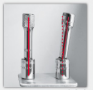
▲スタンダードタイプ (左) との比較