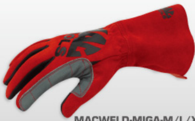
MACWELD-MIGA-M/L/XL/XX Mac Mig 溶接グローブ (M/L/XL/XXL サイズ)