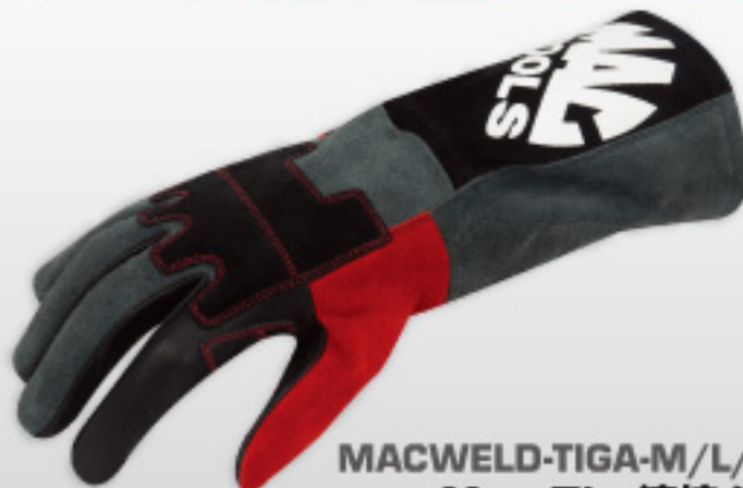
MACWELD-TIGA-M/L/XL/XX Mac Tig 溶接グローブ (M/L/XL/XXL サイズ)