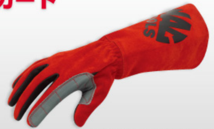
MACWELD-STKA-M/L/XL/XX Mac 被覆アーク溶接グローブ (M/L/XL/XXL サイズ)